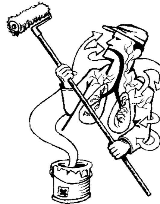
Mynd 1. Leysiefni berast einkum inn í líkamann við innöndun.

Rykgríma Öndunargríma með rykslu P2/P3 Gasgríma Öndunargríma með slú fyrir lífræn leysiefni (A2) Loftgríma Öndunargríma með aðstreyml fersklöts Loftgríma Öndunargríma með aðstreyml fersklöts (hálfgríma) fyrir vötn (munn og nef) (heilgríma) fyrir vötn og augun