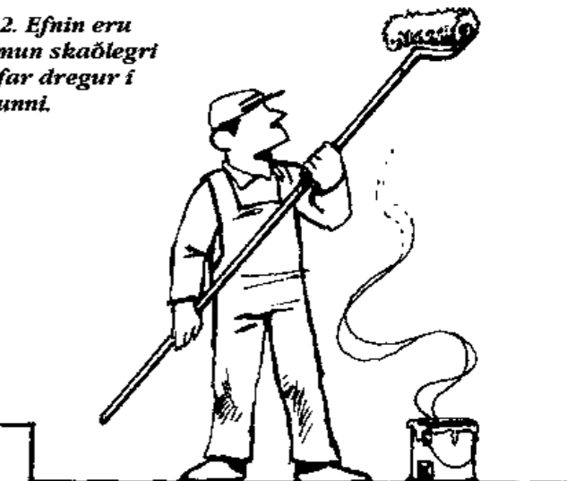
Mynd 2. Efnin eru þeim mun skaðlegri sem ofar dregur í tröppunni.