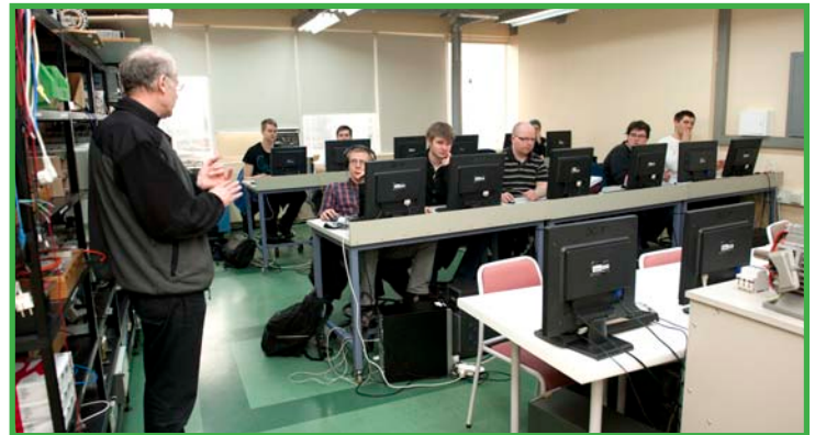
Sérstök áhersla lögð á áhættuþætti í vinnuumhverfinu

Vinnueftirlitið hefur einnig staðið fyrir fagnámskeiðum fyrir öryggisstjóra í fiskvinnslu og hafa þau verið haldin í Reykjavík og á Neskaupstað. Ráðgert er að halda fleiri slík námskeið en gott samstarf hefur verið á milli Vinnueftirlitsins og Samtaka fyrirtækja í sjávarútvegi varðandi verkefnið. Námskeiðin eru sérstaklega ætluð til þess að stórefla vinnuvernd í fiskvinnslu og hefur mikil vinna verið lögð í þróun efnis og faglega nálgun.