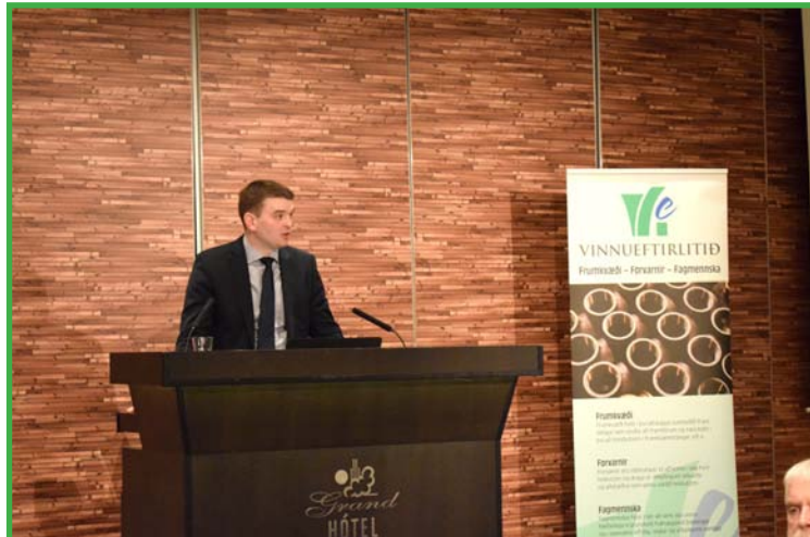
Ásmundur Einar Daðason, félags-og jafnréttismálaráðherra