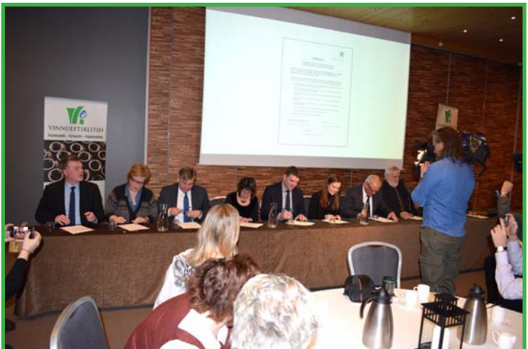
Samtök á vinnumarkaði skrifa undir yfirlýsingu á fundinum

Út er kominn nýr bæklingur um líkamlegt álag við vinnu, þar er farið yfir álagsþætti og leiðir til að minnka álag og vernda stoðkerfið. Bæklingurinn er aðgengilegur á rafrænu formi á vef Vinnueftirlitsins, vinnueftirlit.is . Plakat með heilræðum til að vernda stoðkerfið verður einnig aðgengilegt á vefnum.